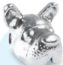
akke-3FBULL (フレンチブルドッグ)