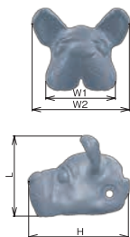
フレンチブルドッグ