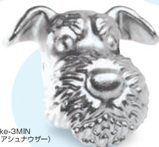
akke-3MIN (ミニチュアシュナウザー)