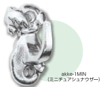
akke-1MIN (ミニチュアシュナウザー)