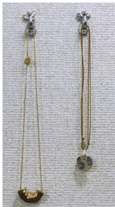
▲フックの部分はシンプル! 使い方は色々