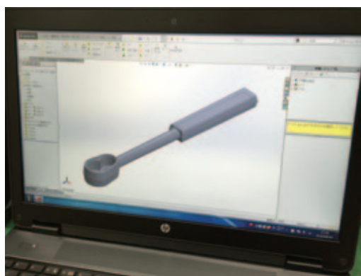
3D CAD SOLIDWORKS