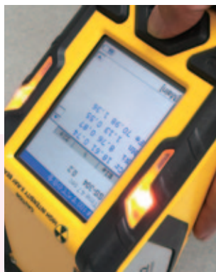
Thermo-NITO 携帯型成分分析計 XL2-800