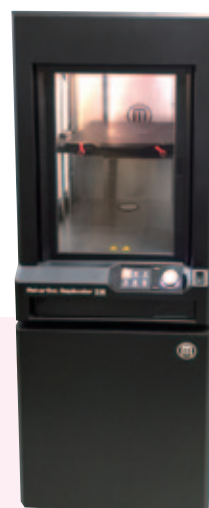
3Dプリンター MakerBot Replicator Z18