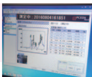
エネルギー分散型 蛍光X線分析装置 EDX-7000