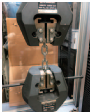
島津製 精密万能試験機 250kN